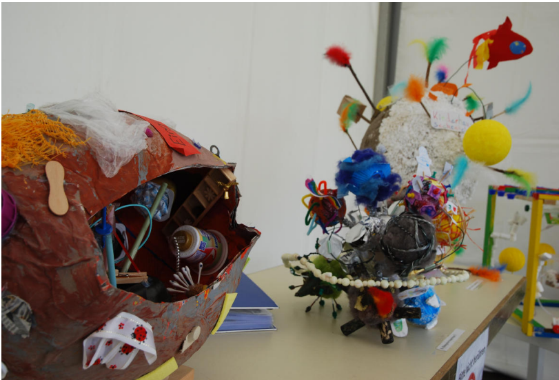
Fantastische Planeten laden zum Verweilen ein.

Am Stand 12-15 erfährt man die spannende Geschichte von Slolly, dem Außerirdischen, und seinem fernen Freund Kai Klötzchen. Im Einführungszelt trifft man auf diese beiden Hauptpersonen, die