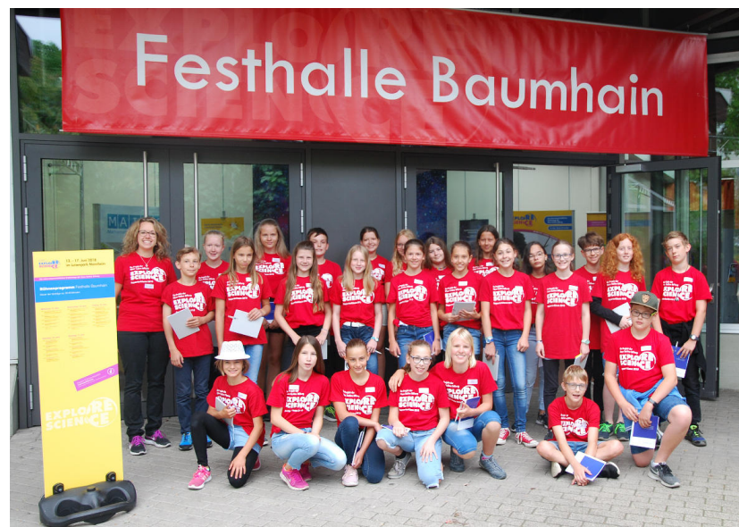
Die Klasse 6a des Leibniz-Gymnasiums Östringen.