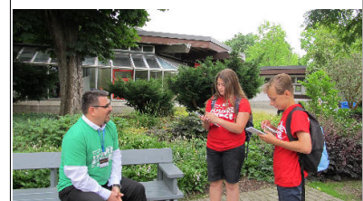
Der Astrofotograf im Gespräch mit den Reportern.