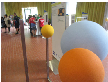
Unsere Sonne (ganz links) ist winzig.