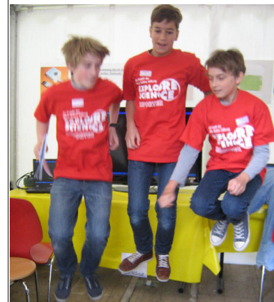
Wenn wir springen, bebt die Erde.

Von Jochen Wiehn, Leon Heieck und Felix Grieb