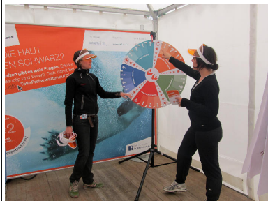
So läuft es bei Jugend präsentiert.