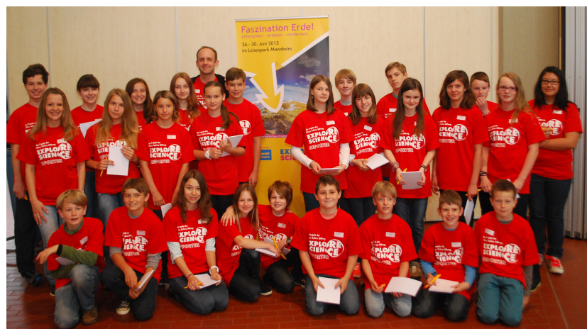
Die Klasse 6a des Sickingen-Gymnasiums Landstuhl.