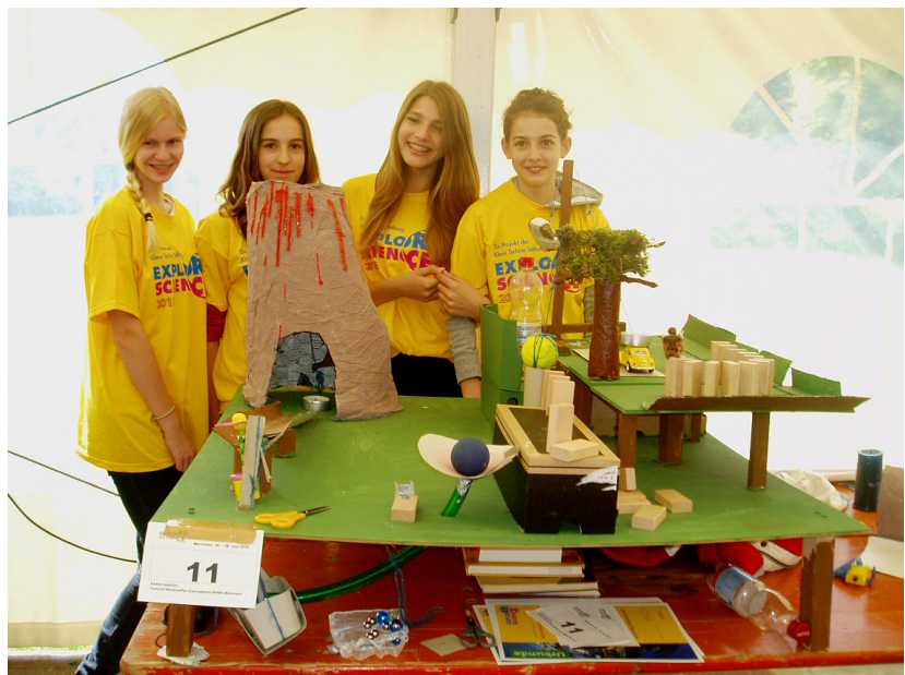
Die Vier vom Konfetti-Vulkan.

Heute haben wir uns den Wettbewerb über Kettenreaktionen angesehen. Die Aufgabe ist sehr einfach zu verstehen. Man muss eine lange und beeindruckende Kettenreaktion bauen, die auch funktioniert. Wir haben die Gruppen 11 und 130 besucht und interviewt.