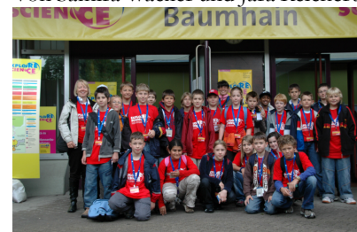
Die Klasse 5c des Kurpfalz-Gymnasium Schriesheim bei Explore Science