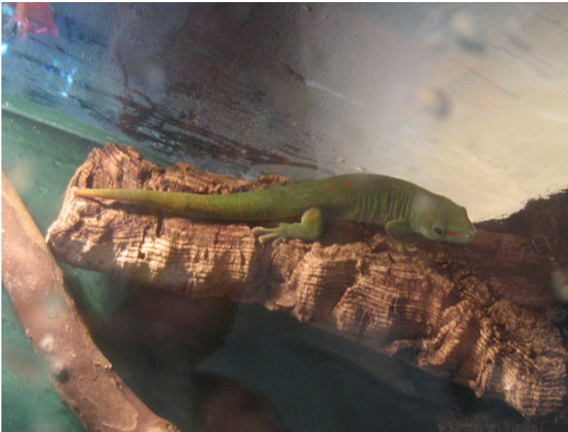
Nicht immer hängt er an der Decke: der Gecko