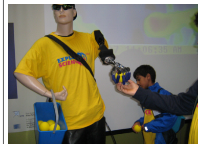
Ein Roboter greift zu

Von Beranavan Manmatharajan, Dominik Völker und Steffen Schwab